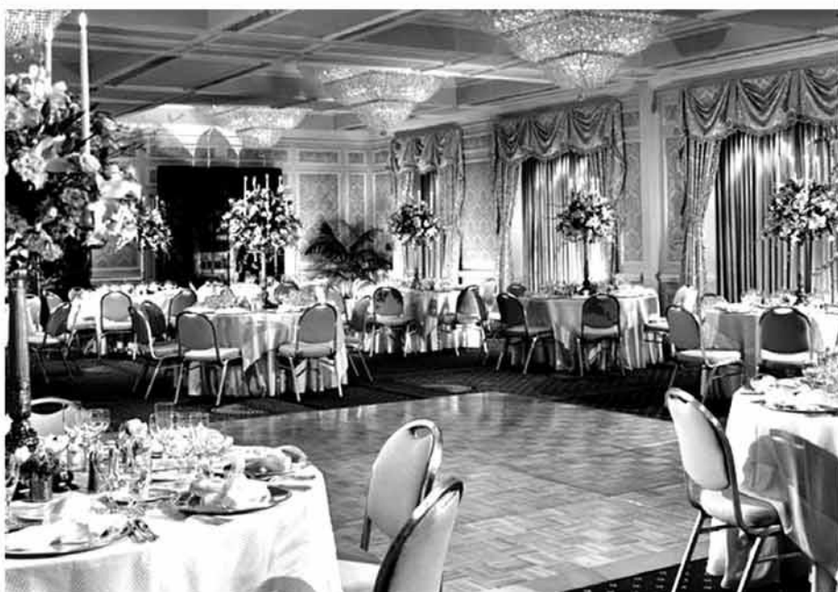
Inter-Continental Hotel, The Barclay, New York City.

Los premios "Edad Dorada" se confieren a individuos que han hecho importantes contribuciones a las comunidades Latino/hispanas a través del mundo. Los premios se entregan por liderazgo efectivo, vida ejemplar, iniciativas de política pública, contribuciones corporativas y participación comunitaria. ■